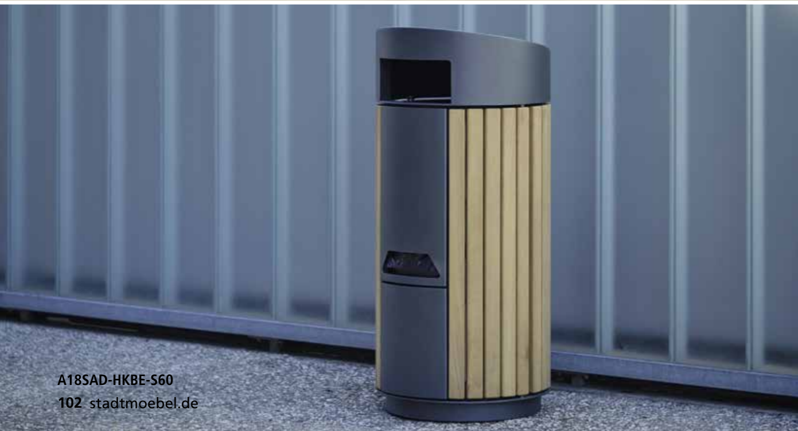
A18SAD-HKBE-S60 102 stadtmoebel.de